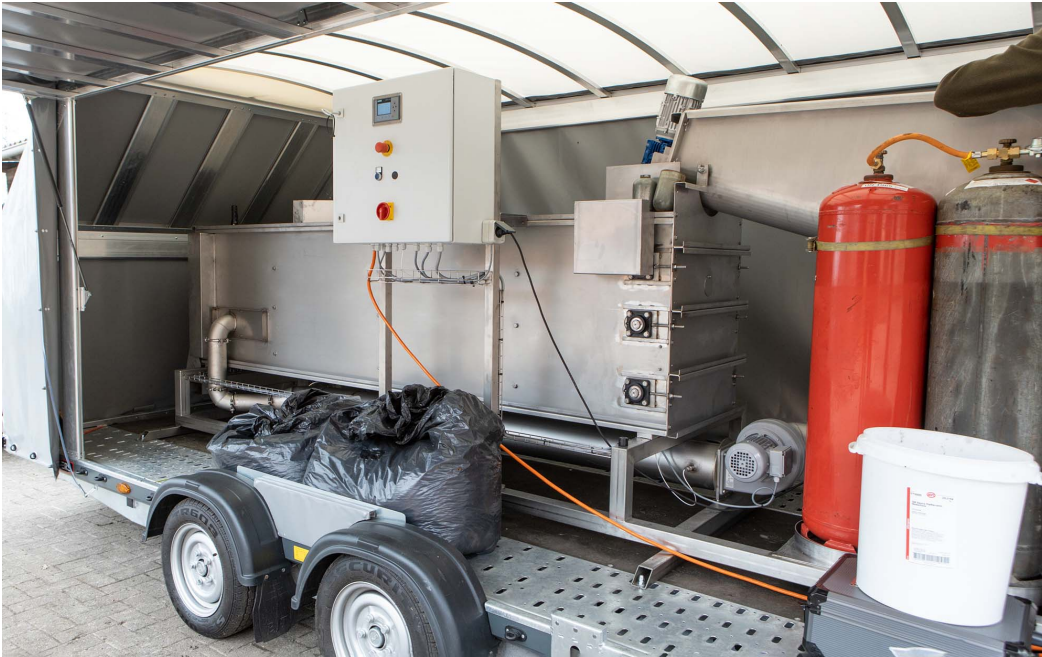
In der mobilen Demonstrationsanlage wird Laub getrocknet, zerkleinert und anschließend mit Gülle vermengt.